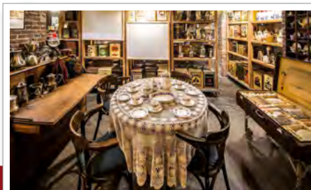
04 Kaffeemuseum Burg: der Duft der braunen Bohnen